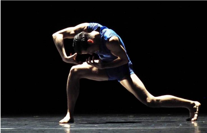
Three van Introdans choreografie: Robert Battle