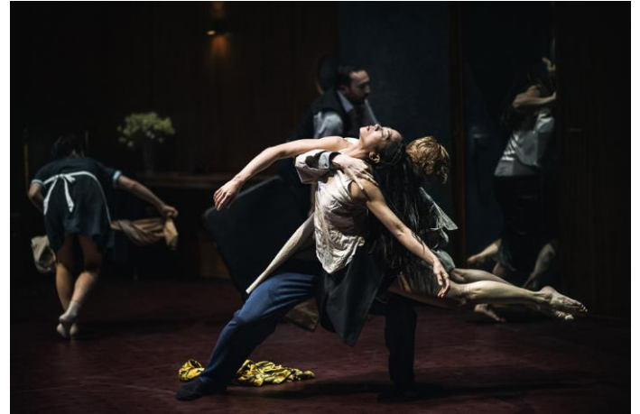
The Lost Room van het Nederlandse Dans Theater choreografie: Franck Chartier